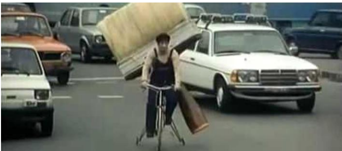
Noto spot televisivo anni '80 di una marca di pennelli.

L'iperbole viene impiegata per rendere efficace un'immagine, incidendo sulla sua dimensione e portandola ad uno dei suoi estremi, e quindi ingrandendola o rendendola più piccola. In sostanza, attraverso l'esagerazione della realtà ne viene, per contrasto, rafforzato il senso e aumentata la forza.