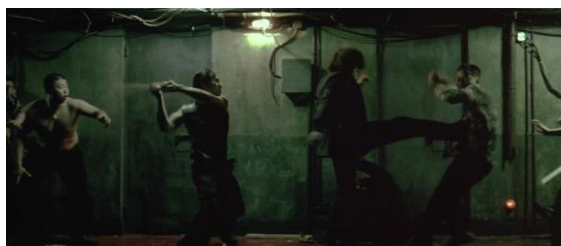
Oldboy, Park Chan-wook - 2003

Ma forse è nella poesia che troviamo gli esempi più celebri: