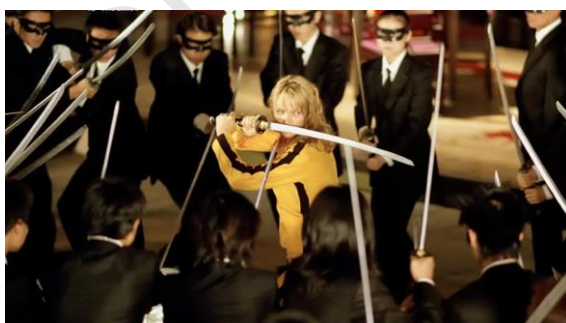
Kill Bill vol.1, Quentin Tarantino – 2003

Siamo anche abituati a iperboli cinematografiche: basti pensare ai film d'azione, dove scene di inseguimento e lotta diventano tanto più tecniche e avvincenti quanto più sono inverosimili. Il principale compito dell'iperbole è di variare il ritmo e il livello della narrazione; questa variazione serve per conquistare l'attenzione dello spettatore.